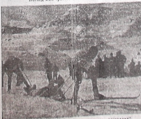
Момент от третия етап — пренасяне на „пострадал“