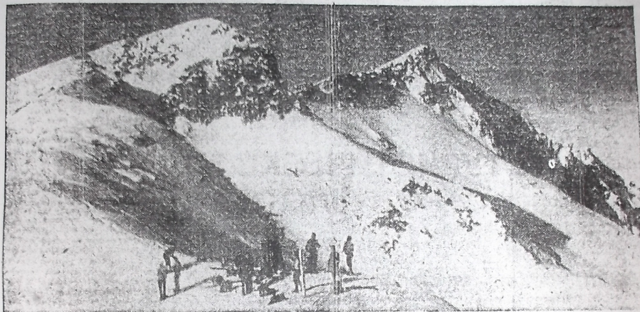
На превала под Бъндеришки чукар

Даната Бъндеришка долина изживя една седмица, изпълнена с оживление, тревоги, напрежение и весел глъч. В Пирин, в омайна къла на Вихрен, се проведе зимната алпиниада и първото алпинско ски-рали у нас.