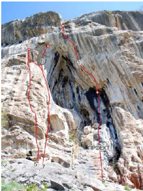
Freerider, Стъклен дом, Гном