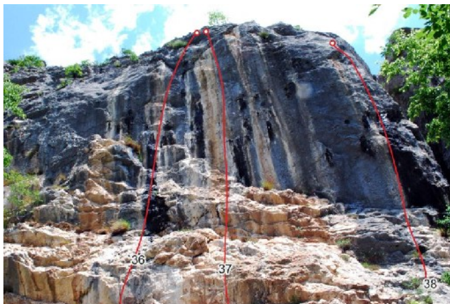
Evil boy, Enter the ninja, Jedi mind