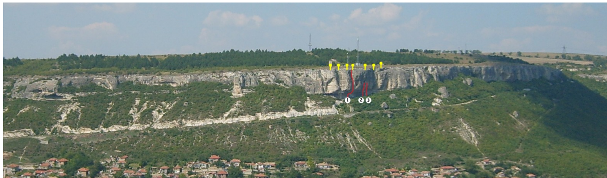
Общ поглед към скалния обект.