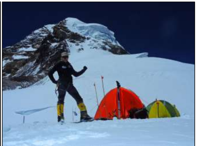
Лагер 4 (8051m) се намира на равна площадка наред гигантски снежен склон.