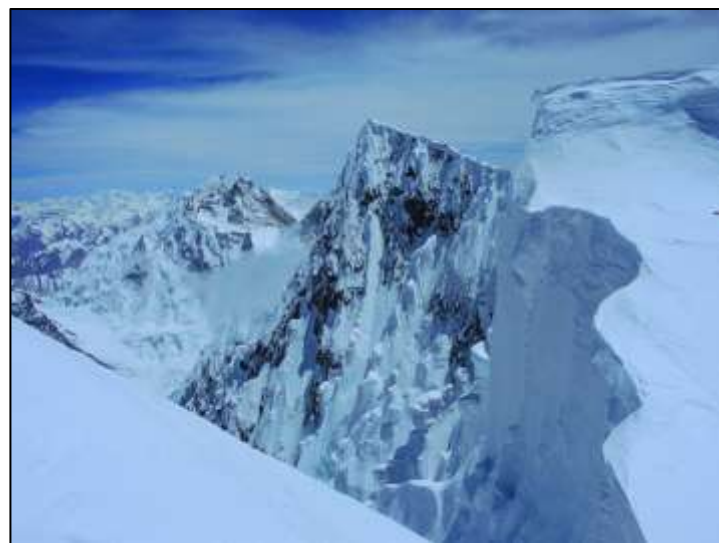
Broad Peak Main (8047m). Главният връх отстои на ок. 1 час ходене от Rocky Summit.