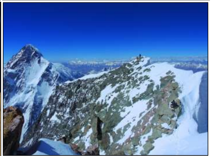
Rocky Summit (8035m). Отстои на ок. 500 m от Главния връх.