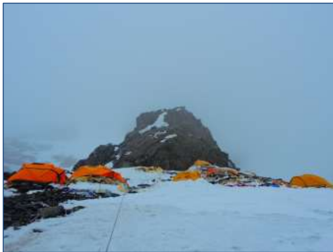
Лагер 2 (6732m). Безопасно може да се опънат не повече от 10 палатки. Изключително замърсено.