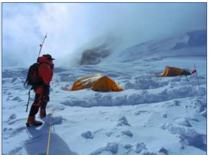
Лагер 3 (7256m). Въпреки, че мястото е заобиколено от цепнатини може да се опънат много палатки.