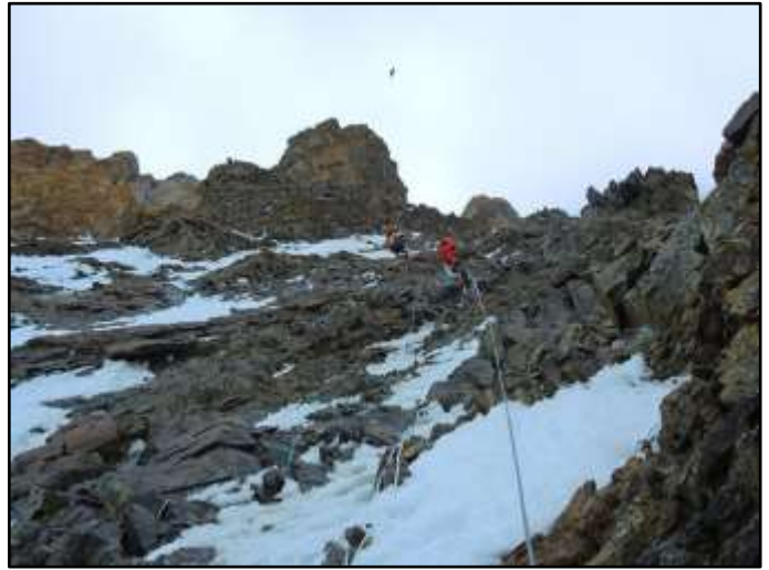
Скален участък между Лагер 1 и 2 (ок. 6500m). В началото на сезона ледът е много повече.