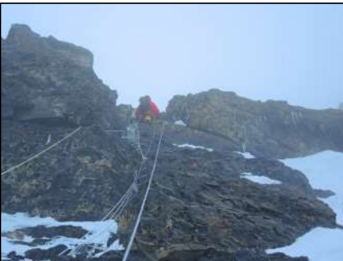
Черната пирамида е техничен участък с много скали между Лагер 2 и 3 (6800-7100m).