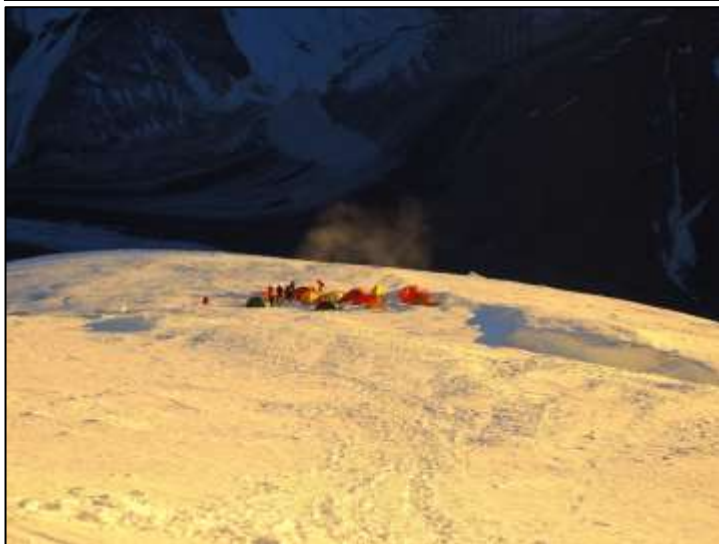
Лагер 3 (7064m). Мястото позволява безопасно опъване на голям брой палатки.