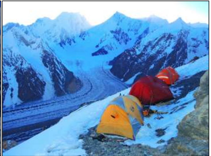
Лагер 2 (6100-6200m). Мястото е достатъчно обширно и позволява опъването на над 20 палатки.