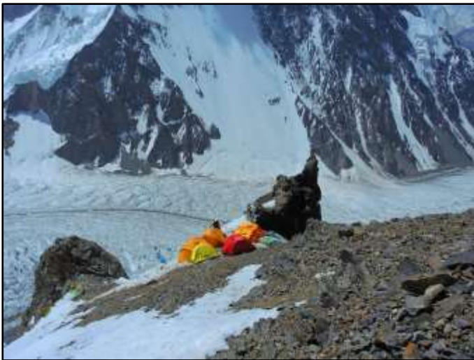
Лагер 1 (6120m). Мястото позволява безопасно опъване на не повече от 6-7 палатки.