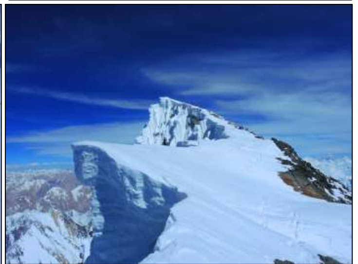
Broad peak Main (8047m). Върхът представлява голяма козирка изнесена към Китай.