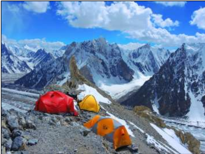
Лагер 1 (5674m). Мястото позволява опъването на не повече от 10 палатки.